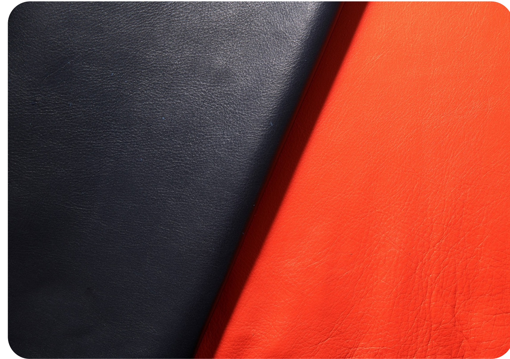
国産牛革スムーズ