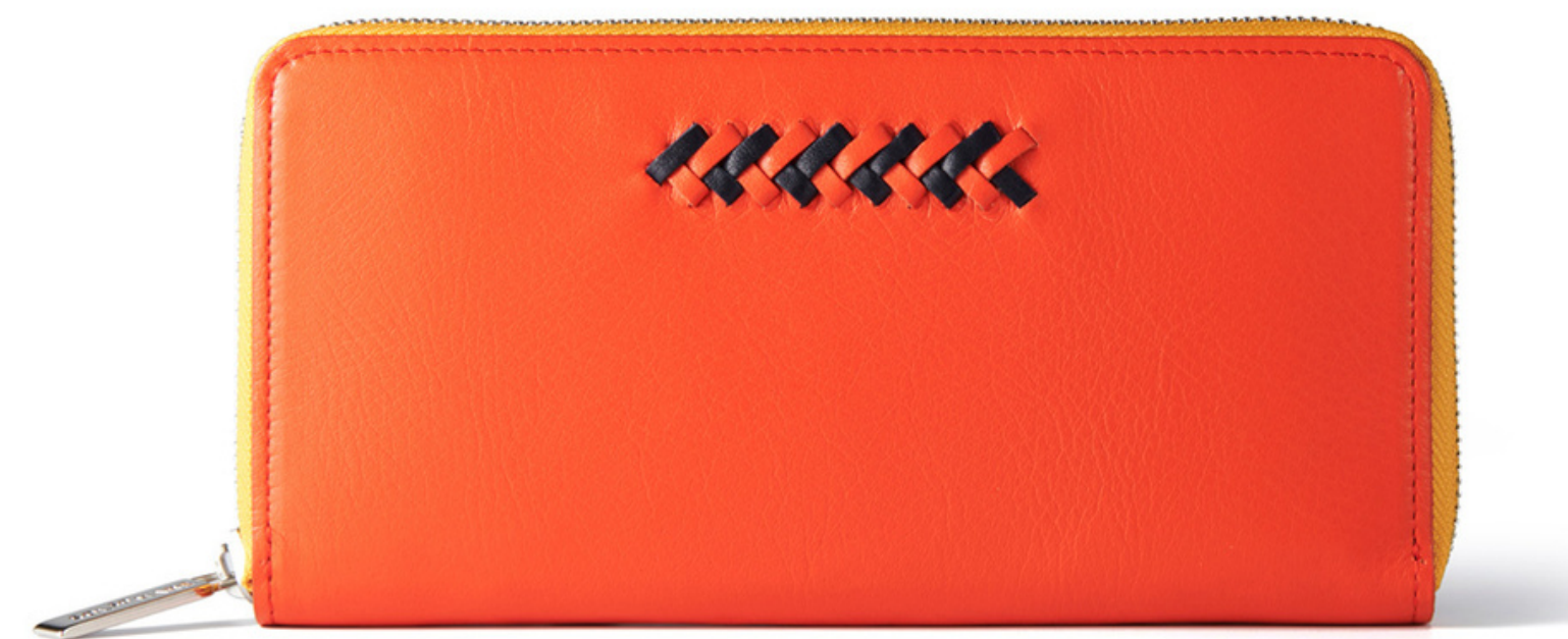
あり (セッカ/ラルゴ)