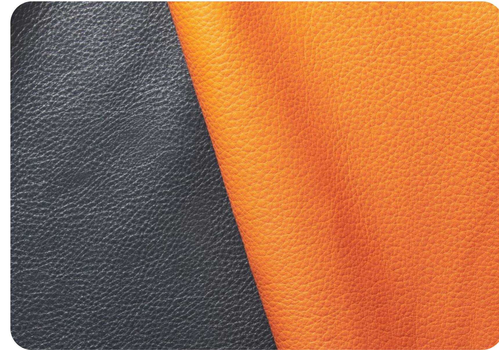
国産牛革 ソフトシュリンク