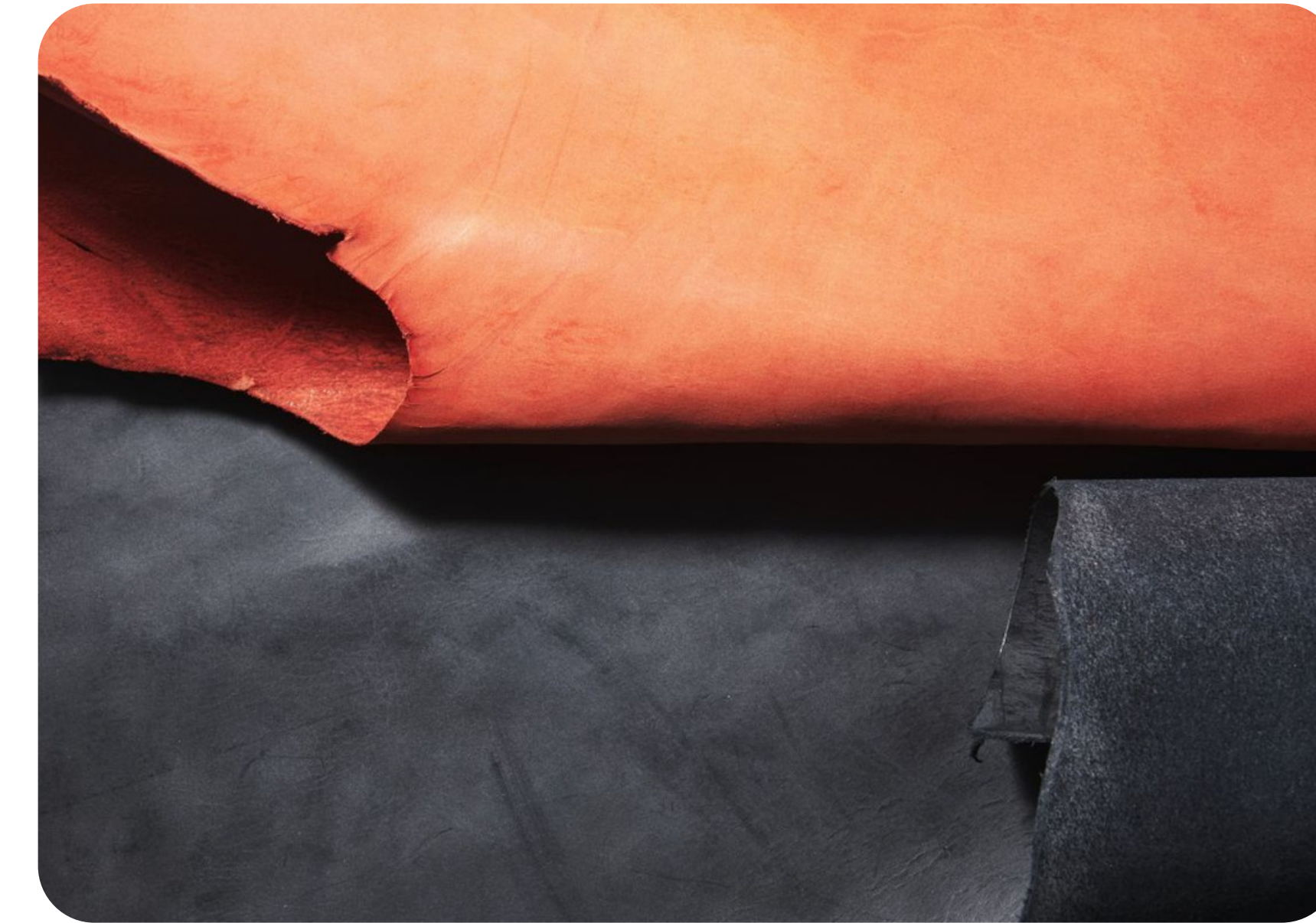
国産牛革ヌメ (口口マレザー)