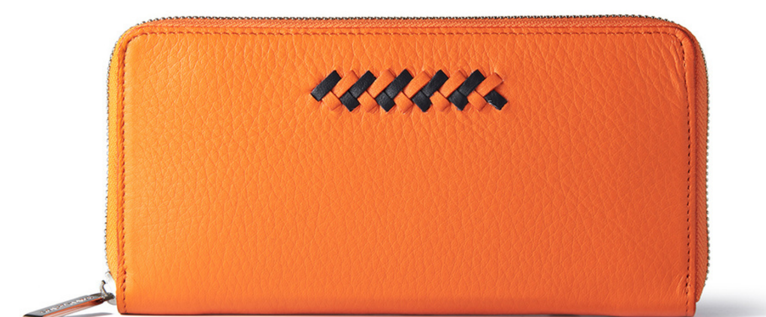
あり (セッカ/ラルゴ)